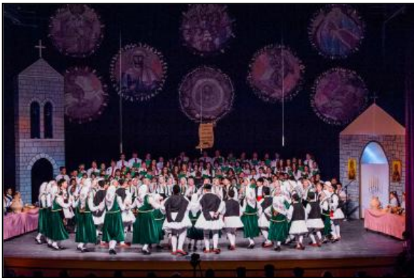
Εἰκόνα 7: Ἡ Ἐνορία Περιβλέπτου στήν τελετὴ λήξης τῶν Ἐνοριακῶν Νεανικῶν Συνάξεων τῆς Ἰ.Μ.Ι. 2014

Στόν ἴδιο χῶρο διεξάγονται καὶ τὰ μαθήματα σκακιοῦ (80 παιδιά σήμερα), χορωδίας καὶ χειροτεχνίας-κατασκευῶν (ὅλα τὰ παιδιά τῶν νεανικῶν συνάξεων). Τὰ παιδιά γιὰ νὰ ἀποκτήσουν παραστάσεις ἀλλὰ κυρίως βιωματικές ἐμπειρίες μέσα στόν χῶρο τῆς Ἐκκλησίας συμμετέχουν σὲ προσκυνηματικές ἐκδρομές καὶ σὲ καλοκαιρινές κατασκηνώσεις, ποὺ διοργανώνονται ἀπὸ τὴν Ἐνορία ἢ ἀπὸ τὴ Διεύθυνση Νεότητος τῆς Ἱερᾶς Μητροπόλεώς μας.