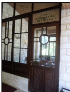
Εικόνα 10: Γραφείο Ενοριακής Μέριμνας.

Στήν Ένορία μας τὰ τελευταία χρόνια ίδρύσαμε καὶ λειτουργοῦμε στή θέση τοῦ Φιλοπτώχου Ταμείου μία παρεμφερῆ δομῆ, τὴν ὀνομαζόμενη «Ένοριακή Μέριμνα», πού σκοπὸ ἔχει νὰ διακονήσῃ τὴν ἀρετὴ τῆς φιλανθρωπίας πρὸς τοὺς «ἔχοντας χρεῖαν» ἀδελφούς μας. Ἔχει ἐγγεγραμμένα μέλη τὰ ὁποῖα καταβάλλουν ἐτήσια συνδρομὴ, καθὼς καὶ μέλη πού ἐνισχύουν τὸ ἔργο τῆς μὲ χρηματικὲς δωρεές.