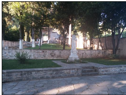
Εἰκόνα 18: Μνημεῖο παπα-Θωμᾶ Μέκαλη καί μνημεῖο Μπιζανομάχων.