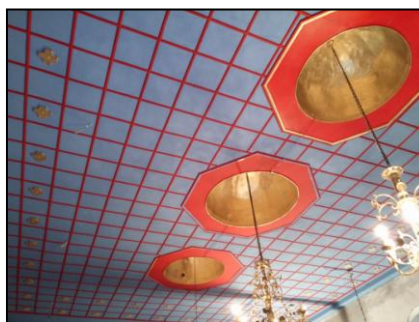
Εἰκόνα 17: Ἐργασίες ἀνακαίνισης τοῦ Ι. Ν. Ἀγ. Κοσμᾶ.