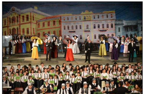
Εἰκόνα 6: Μουσικοχορευτικὲς ἐκδηλώσεις τῶν «Νεανικῶν Συνάξεων»