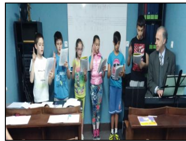
Εἰκόνα 5: Ομαδικὸ μάθημα σολφῆς

Αναλυτικότερα, δίνεται ή δυνατότητα εκμάθησης ηλεκτρονικῶν ὑπολογιστῶν (Η/Υ) σὲ παιδιά καὶ ἐνήλικες τῆς Ἐνορίας μετὰ ἀπὸ κατάθεση σχετικῆς αἴτησης στὸν χῶρο τοῦ Καμπερείου Πνευματικοῦ Ἰδρύματος τῆς Ἱερᾶς Μητροπόλεως Ἰωαννίνων (Εἰκ. 5). Οἱ μαθητές (120 παιδιά τῆς Ἐνορίας Περιβλέπτου σήμερα) κατατάσσονται σὲ τμήματα ἀνάλογα μὲ τὸ ἐπίπεδο γνώσεών τους καὶ ἐκπαιδεύονται σὲ Η/Υ σύγχρονου λογισμικοῦ. Στὰ πλαίσια αὐτῆς τῆς ἐκπαίδευσης τὰ παιδιά ἔχουν τὴν εὐκαιρία εκμάθησης βασικῶν γνώσεων πληροφορικῆς, γλωσσῶν προγραμματισμοῦ, ρομποτικῆς καὶ δυνατότητα προετοιμασίας γιὰ συμμετοχὴ σὲ ἐξετάσεις ἀπόκτησης εὐρωπαϊκοῦ διπλώματος κατάρτισης στοὺς Η/Υ (ECDL Core, Cambridge IT Skills Standard) σὲ ὁποιοδήποτε ἐξεταστικὸ κέντρο τῆς πόλης.