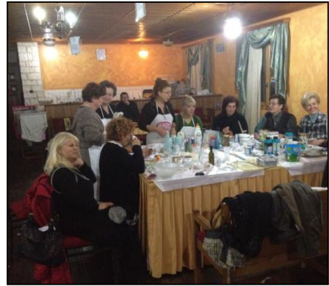
Εικόνα 12: Εικαστικό εργαστήριο.

Κάθε Τετάρτη στη δεύτερη αίθουσα της Ένορίας λειτουργεί τμήμα εικαστικών και δημιουργικής απασχόλησης, στο οποίο συμμετέχουν περίπου τριάντα (30) γυναίκες. Στο τμήμα αυτό υλοποιούνται κατασκευές ποικίλων τεχνοτροπιών, τις οποίες και διαθέτουν στην Ένοριακή Μέριμνα με σκοπό την πώλησή τους και την εξεύρεση χρημάτων για την επίτευξη του σκοπού της. Συγκεκριμένα τὰ μέλη του τμήματος κατασκευάζουν: