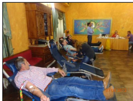
Εικόνα 14: Αἱμοδοσία.

Στην Ένορία μας τὸ ἔτος 1999 ιδρύθηκε καὶ λειτουργεῖ Τράπεζα Αἵματος μὲ τὴν ὀνομασία «Ζωοδόχος Πηγή». Κάθε ἕξι (6) μῆνες, δηλαδή δυὸ φορές τὸν χρόνο, ὀργανώνεται ἀπὸ τὴν Ένορία μας καὶ πραγματοποιεῖται σὲ συνεργασία μὲ τὸ τμήμα Αἱμοδοσίας τοῦ Περιφερειακοῦ Γενικοῦ Νοσοκομείου «Χατζηκώστα» αἱμοληψία μὲ τὴν ἐθελοντικὴ συμμετοχὴ Κληρικῶν καὶ λαϊκῶν μελῶν τῆς Ἱερᾶς Μητροπόλεώς μας.