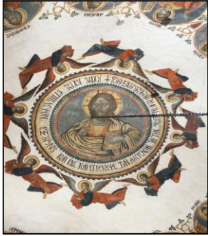
Εικόνα 16: Ο κεντρικός τροῦλος μετά ἀπό τή συντήρηση.

Τὰ τελευταῖα χρόνια, μὲ τὴ βοήθεια εἰδικῶν ἐπιστημόνων καὶ σύμφωνα μὲ τὰ ἐλάχιστα ἐνδεικτικὰ στοιχεῖα πού ἀποκαλύπτονται σταδιακά, ξεκίνησε μία προσπάθεια ἀπὸ τὴν Ἐνορία μὲ μεθοδικὰ βήματα νὰ ἐπανέλθει ὁ Ναὸς σὲ μία μορφή πού νὰ πλησιάζει ὅσο τὸ δυνατόν περισσότερο στὴν ἀρχική. Γι' αὐτὸ ὑλοποιήθηκαν στὸν κεντρικὸ Ἱερὸ Ναὸ οἱ παρακάτω ἐργασίες: