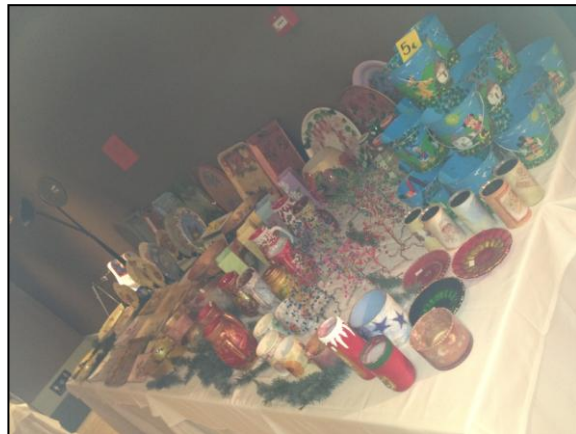
Εικόνα 13: Κατασκευές και έργόχειρα του Εικαστικού εργαστηρίου.