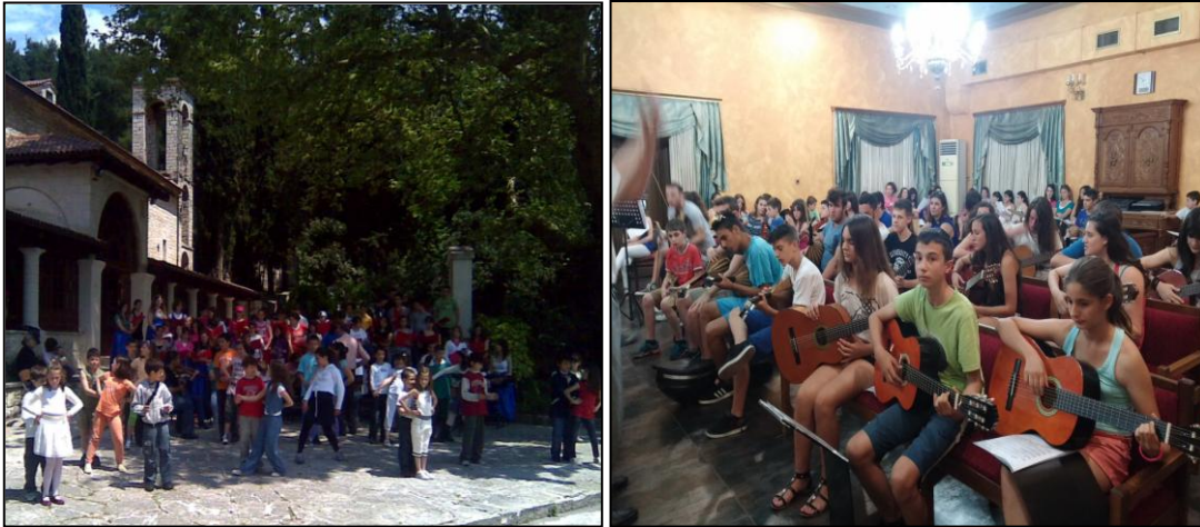
Εικόνα 2: Δραστηριότητες Νεανικών Συνάξεων