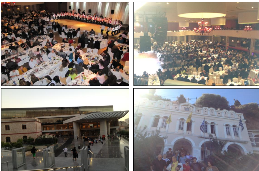
Εικόνα 11: Εκδηλώσεις καὶ δραστηριότητες τῆς «Ἐνοριακῆς Μέριμνας».