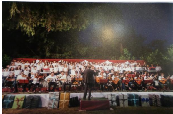
Εἰκόνα 8: Ἐτήσια ἐκδήλωση Μουσικοῦ Ἐργαστηρίου – ἀφιέρωμα στόν Μ. Χατζηδάκι.